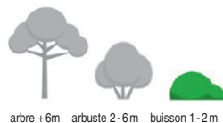
arbre +6m arbuste 2-6m buisson 1-2m