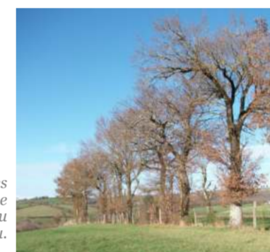
Sans clôture, pas de renouvellement naturel : les semis, très appétants, sont broutés. Elle se pose devant l'alignement d'arbres ou la haie, pas au milieu.