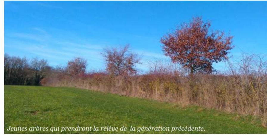
Jeunes arbres qui prendront la relève de la génération précédente.