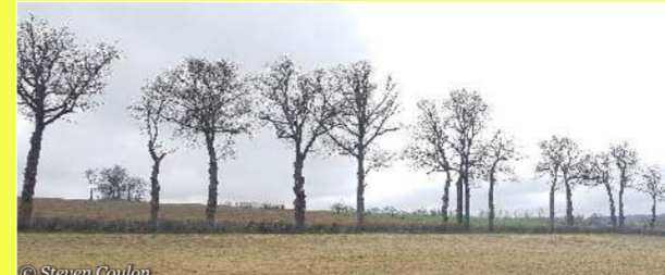
Chênes fraîchement émondés sur la commune de Flavin.

Si le Chêne pédonculé est emblématique des plateaux, on peut rencontrer d'autres espèces : Chêne sessile, tauzin ou encore pubescent.